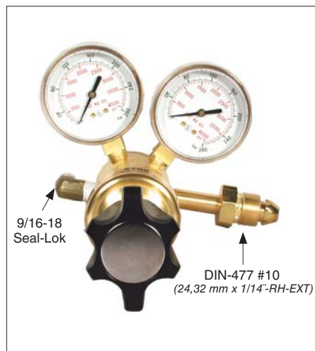
Druckregler 90.310.203 200 bar