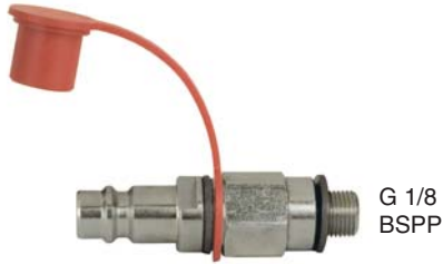
Schnelltrenn-Befüllanschluss 90.310.111 (CN-10)