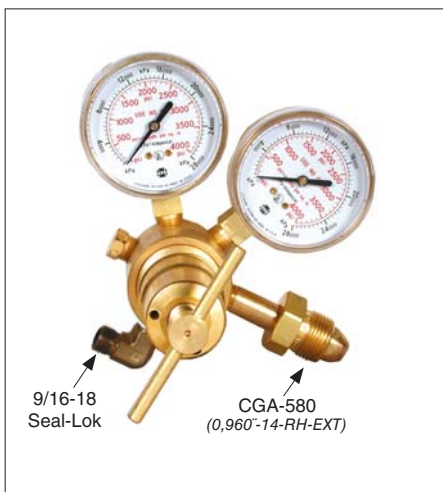
Druckregler 90.310.201 200 bar

Die Art des Druckreglers bestimmt den Anschluss zur Stickstoff-Flasche.