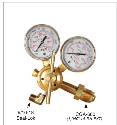
Druckregler 90.310.205 310 bar