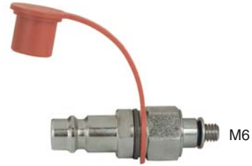
Schnelltrenn-Befüllanschluss 90.310.143 (CN-4)