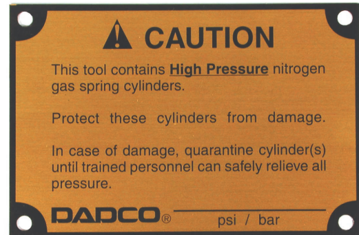
Artikel-Nr. 90.488.3 (Englisch) Artikel-Nr. 90.488.4 (Spanisch)