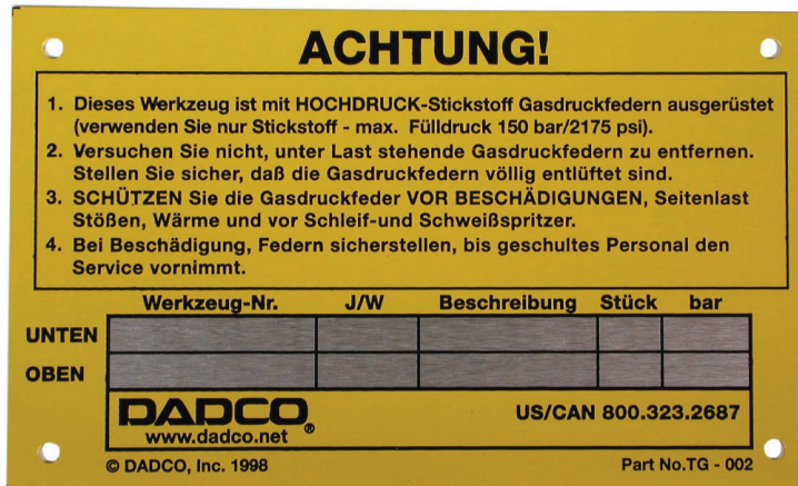
Artikel-Nr. TG-002 (Deutsch) Artikel-Nr. TG-001 (Englisch)